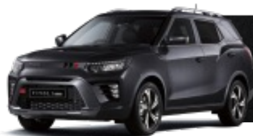
SPACE BLACK (LAK)