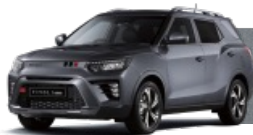
PLATINUM GREY (ADA)